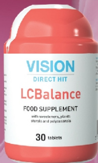
LC Balance, Vinex Wzmocnienie układu krążenia