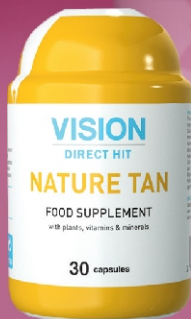
Nature Tan Ochrona skóry przed promieniowaniem UV